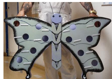
Papillon de l'AJA